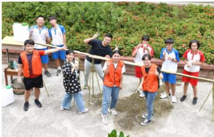
靜宜大學「夏日霄遊七夕祭」體驗台日傳統文化 點燃地方創生新火花